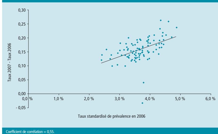
Figure 3 Diagramme de dispersion de l'évolution de la prévalence départementale du diabète traité (taux 2007 – taux 2006) selon la prévalence départementale en 2006 (données France métropole, régime général d'assurance maladie) / Figure 3 Scatter diagram on the evolution of departmental treated diabetics prevalence rates (2007 rates – 2006 rates) depending on departmental prevalence in 2006 (data of mainland France, general scheme of French National Health Service)

A contrario le taux de croissance annuel n'était pas significativement corrélé au niveau initial de prévalence. Si cette tendance se poursuivait dans les années à venir, l'écart entre départements pourrait s'accroître au cours du temps.