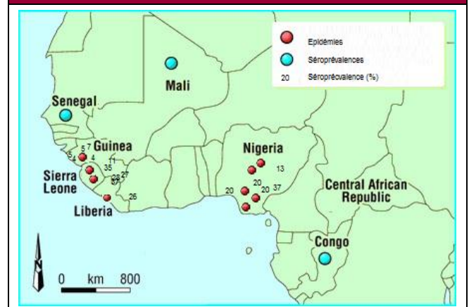
Carte 1 – Epidémies et séroprévalence du virus Lassa en Afrique de l'ouest jusqu'en 2007 – cartographie adaptée 1, 2