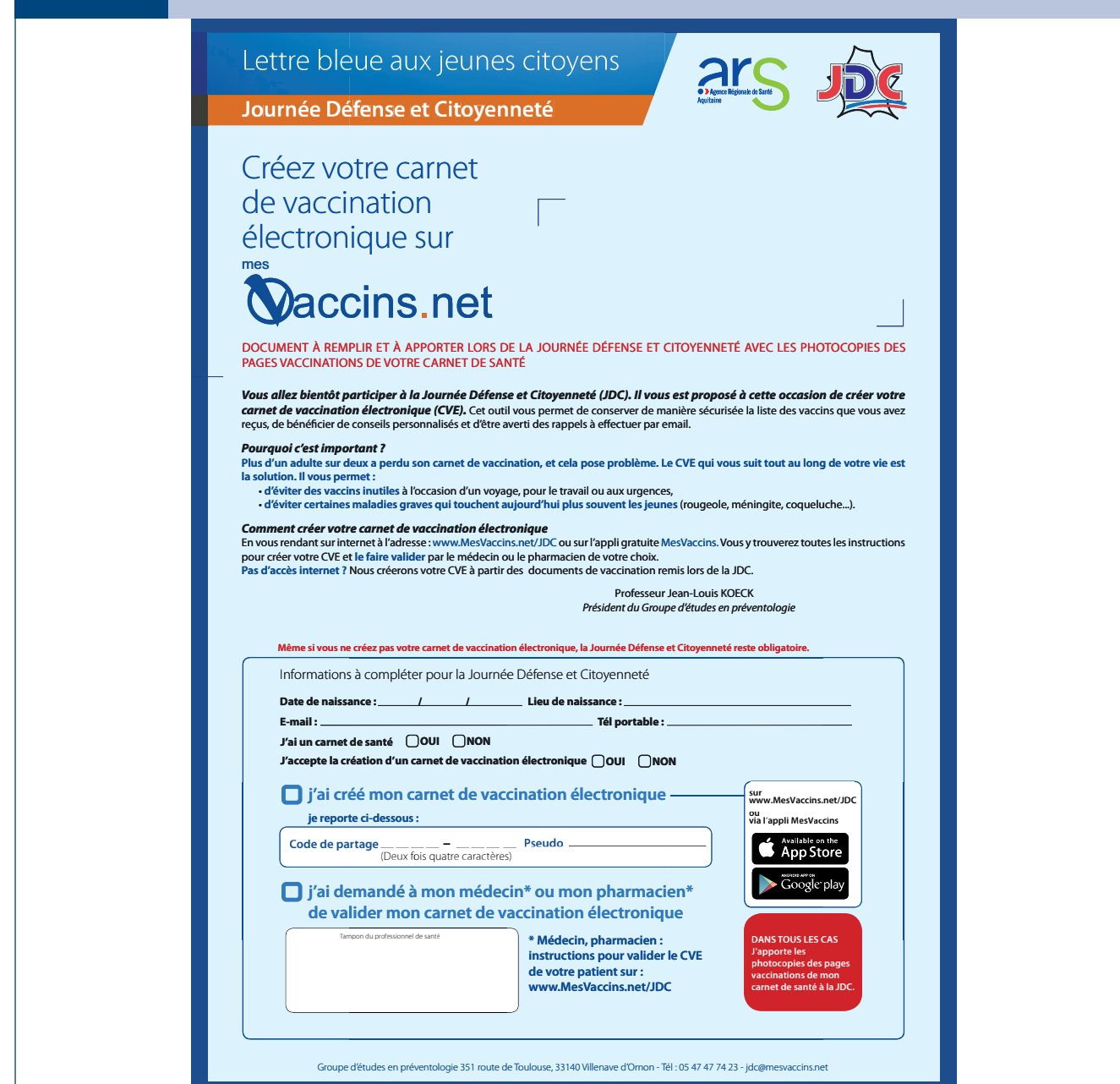
FIGURE 1 LETTRE ENVOYÉE AUX JEUNES CITOYENS